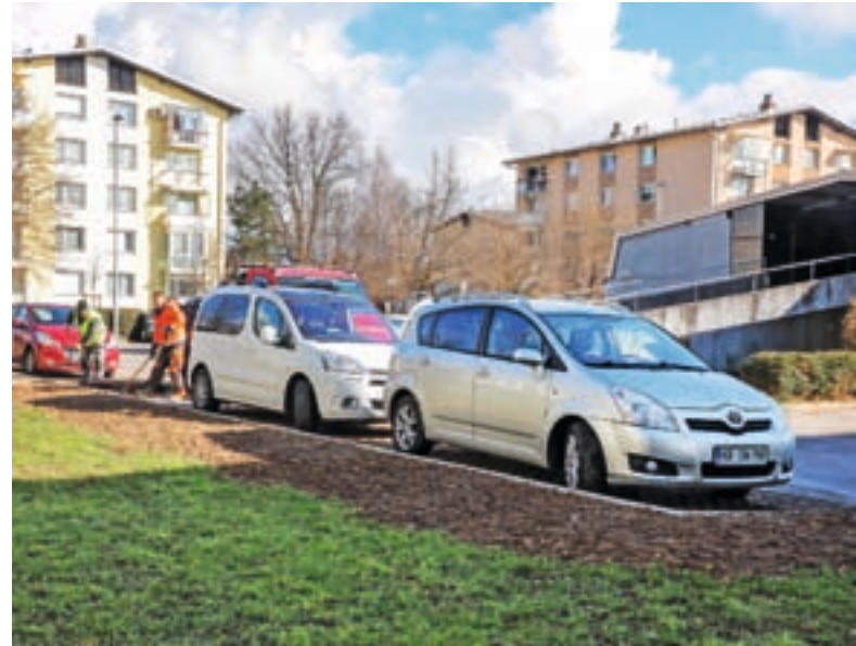
Nova bočna parkirna mesta na Zoisovi ulici

»Zavedamo se težav zaradi pomanjkanja parkirišč in ves čas iščemo rešitve. S tem se soočajo po večini slovenskih mest in Kranj ni pri tem nikakršna izjema. Ko so se v drugi polovici