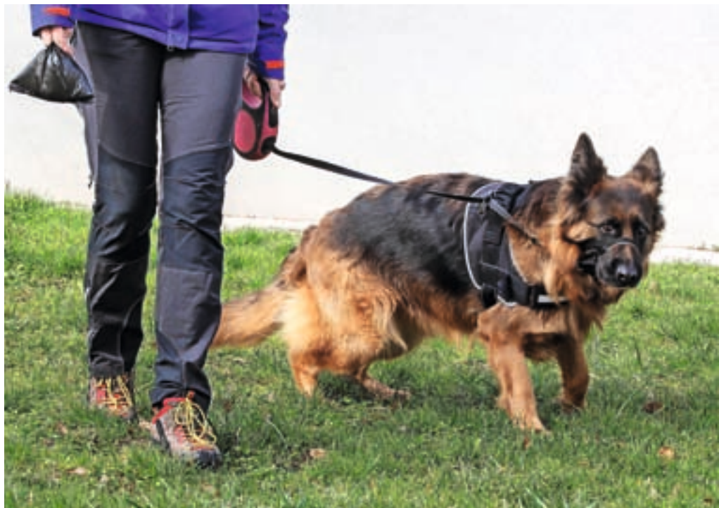
Po odloku o javnem redu v mestni občini Kranj je skrbnik živali dolžan za živaljo počistiti iztrebke na javnih površinah.