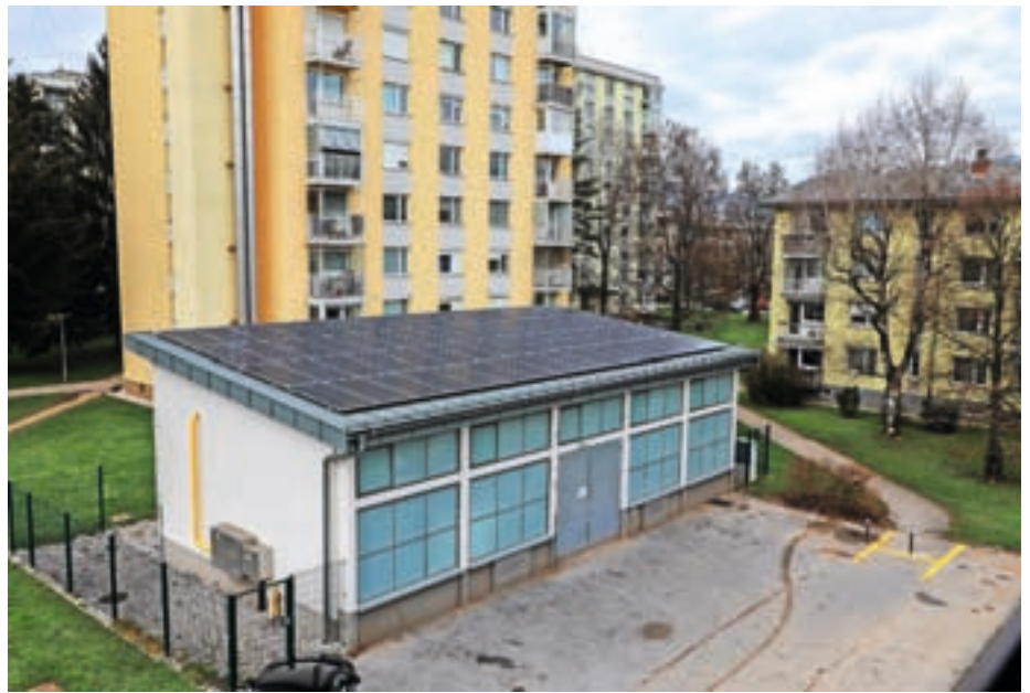
Sončna elektrarna na kotlovnici Šorlijevo naselje / Foto: Tina Dokl

Kot je še pojasnil Drinovec, je zagotovljen tudi prostor za nadgradnjo sistema ogrevanja s toplotnimi črpalkami,